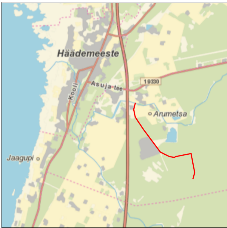
Kaardileht nr 5314 Häädemeeste